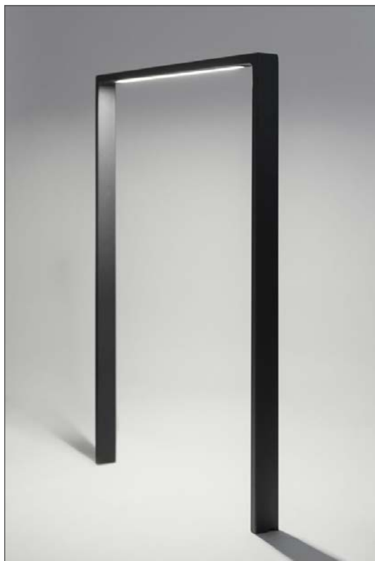
Protection du modèle N°20 2017 105 513.