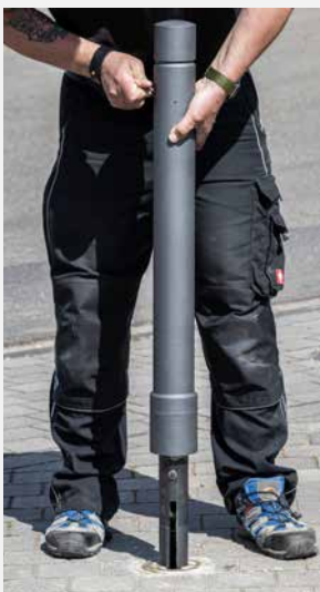
Bequeme und intuitive Entnahme bei geringem Kraftaufwand.