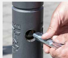
Erhältlich mit 3-Kantverschluss oder Schließzylinder