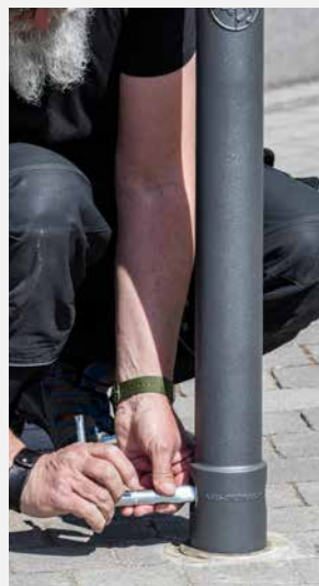
Poller mit Verbindungsstück (3p-Technologie) passen in dieselbe Bodenhülse.